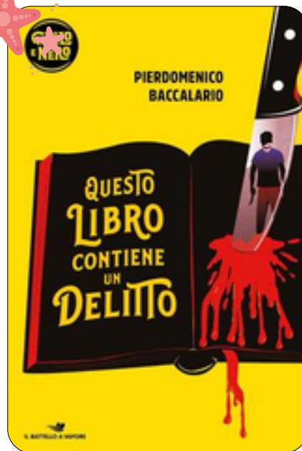
Questo libro contiene un delitto Pierdomenico Baccalario 142 p., Piemme, 2023