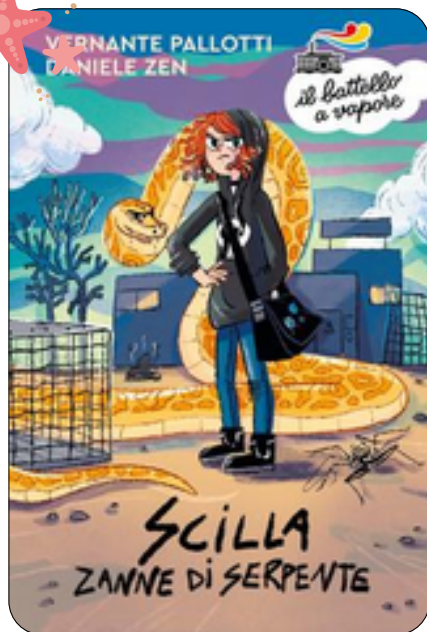
Scilla zanne di serpente Vernante Pallotti, Daniele Zen 185 p., Piemme, 2024