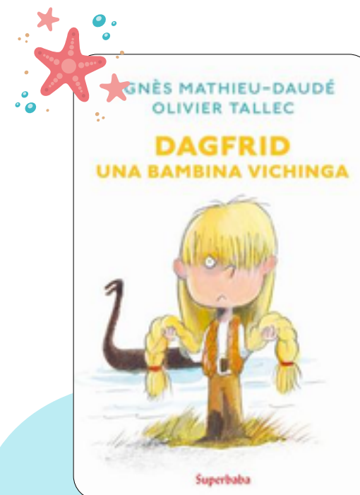
Dagfrid Agnès Mathieu-Daudé 47 p., Il castoro, 2024