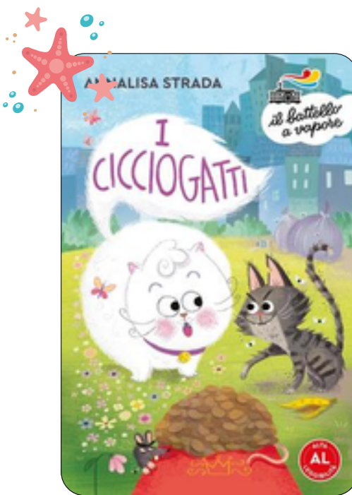
I cicciogetti Annalisa strada 35 p., Piemme, 2024