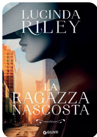
La ragazza nascosta Lucinda Riley 559 p., Giunti, 2024

il materiale della biblioteca NON deve essere sottolineato