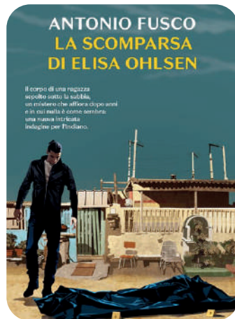
La scomparsa di Elisa Ohlsen Antonio Fusco 252 p., Rizzoli, 2024

Sono mesi che Anita fa cose poco consone, per non dire disdicevoli: come rimandare il matrimonio con Corrado solo per il desiderio di lavorare, oppure scrivere, sotto lo pseudonimo di J.D. Smith, racconti gialli ispirati a fatti di cronaca per portare un po' di giustizia dove ormai non ne esiste più. Un segreto che condivide con Sebastiano Satta Ascona, direttore della rivista «Saturnalia» con cui, a essere sinceri, scrivere non è l'unica cosa proibita che fa. Qualcuno però ha iniziato a seguirli, e con le spie meglio non scherzare, meglio fare quello che chiedono, anche se le richieste minacciano di stravolgere l'esistenza pacifica degli amici più stretti: la saggia Clara, l'irriverente Candida, la dolce Diana, l'affascinante Julian, il ribelle Rodolfo e il suo Sebastiano. Perché non possono fidarsi di nessuno? Perché non smettono di attirare attenzioni indesiderate?